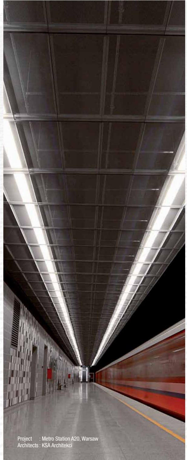
Project : Metro Station A20, Warsaw Architects : KSA Architekci

Les plafonds métal déployé Luxalon® de Hunter Douglas allient style et fonctionnalité : la solution idéale pour les bâtiments utilitaires, les aéroports, les centres commerciaux et les centres de loisirs. Le large choix de matières, couleurs et modèles offre aux architectes une liberté de design contemporain pour que chaque projet soit unique.