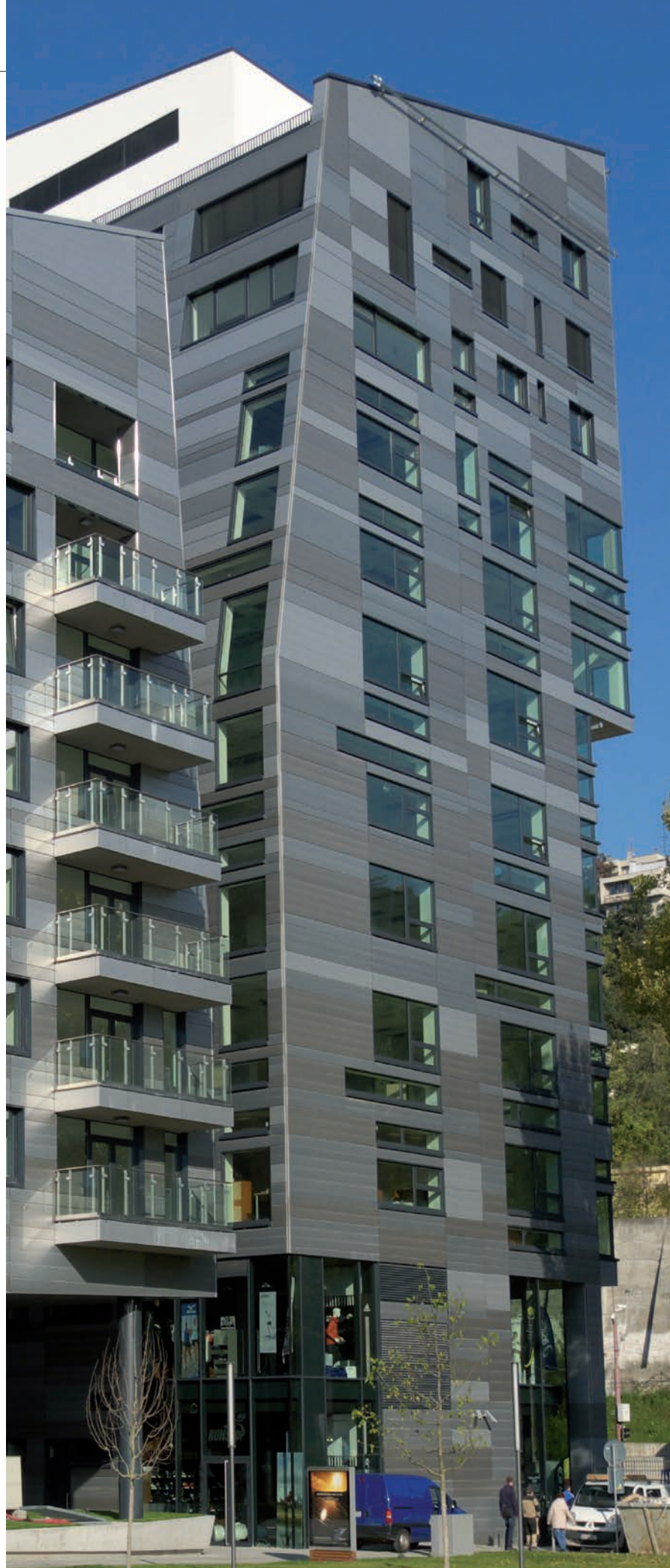
A droite : River Park, Bratislava, Slovaquie Produit : MPF 150F/200F en 3 couleurs Architecte : Erick van Egeraat

Un pré traitement d'excellence et un revêtement de couleur stable ne suffisent pas à créer un produit performant ; le bon alliage d'aluminium est tout aussi important. Afin d'atteindre un niveau optimal de durabilité, Hunter Douglas utilise un type d'alliage d'aluminium extrêmement résistant à la corrosion : EN AW 3005 ou équivalent.